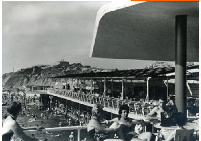
מוזיאון תל אביב לאומנות

התערוכה בוחנת את יחסי העיר והים כפי שהתפתחו במהלך מאה השנים האחרונות, זאת דרך התייחסות לתכנון רצועת החוף על ידי האדריכל ורנר יוסף ויטקובר, אשר היה אמון על תכנון חוף הים מגינת לונדון ועד לצפון גן העצמאות בשנות השישים. התערוכה מתייחסת גם לתרומה של יעקב רכטר ולואיג'י פיצ'ינטו לתכנון רצועת החוף כמו גם לפיתוחה בעשורים האחרונים על ידי מוריה-סקלי אדריכלות נוף, ישר אדריכלים ומייזליץ-כסיף אדריכלים.