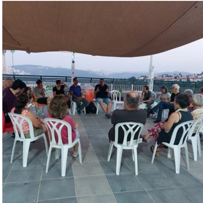
מפגש פעיל סביבה ב"מרפסת הירוקה" במבשרת ציון.

האתגר העיקרי שאני רואה בפנינו בתוך המאבק הוא המתח בין עמדות סביבתיות 'קיצוניות', שאולי ניתן לכנות בחיבה את המחזיקים בהן early adopters , לבין הצורך המעשי לקדם אג'נדות בפועל ולהצליח לזכות בתמיכה ציבורית ולדעת רוב. במסגרת צוות תוכן אנחנו מנסים לרכז את עיקרי הסוגיות והשאיפות, ולהצליח לנסח את אותו מצע מוסכם שאליו יוכלו להתייחס המועמדים והסיעות. אנחנו מגבשים מצע עם היבטים תכנוניים כמו ציפוף פנימה או פיתוח מקיים, אבל השאלה מיהו הריבון - ה'דמוס' - (העם) או גורמי המקצוע מרחפת מעל הפעילות עצמה.