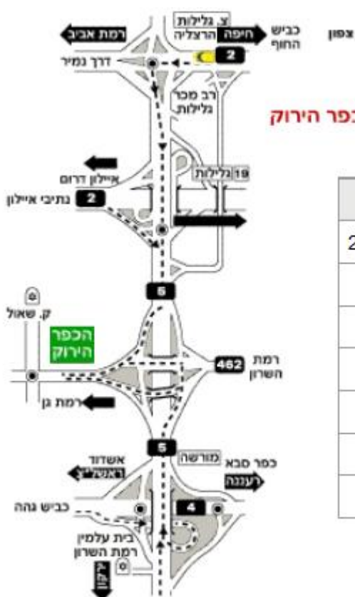
דרכי הגישה לכפר הירוק

חניה- לאחר שעוברים את הכניסה יש לעקוב אחרי השילוט לחניה. החניה חופשית.